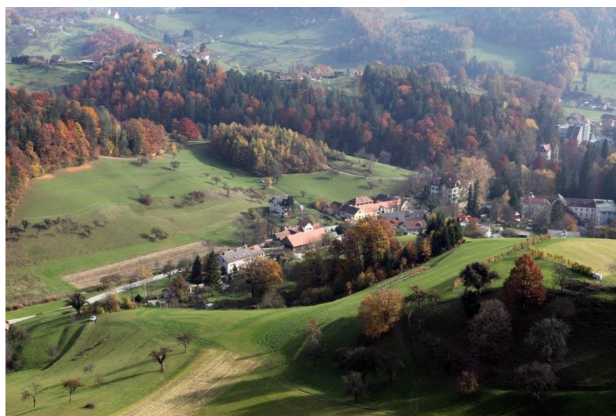
Slika: Območje LN Zora v Dobrni