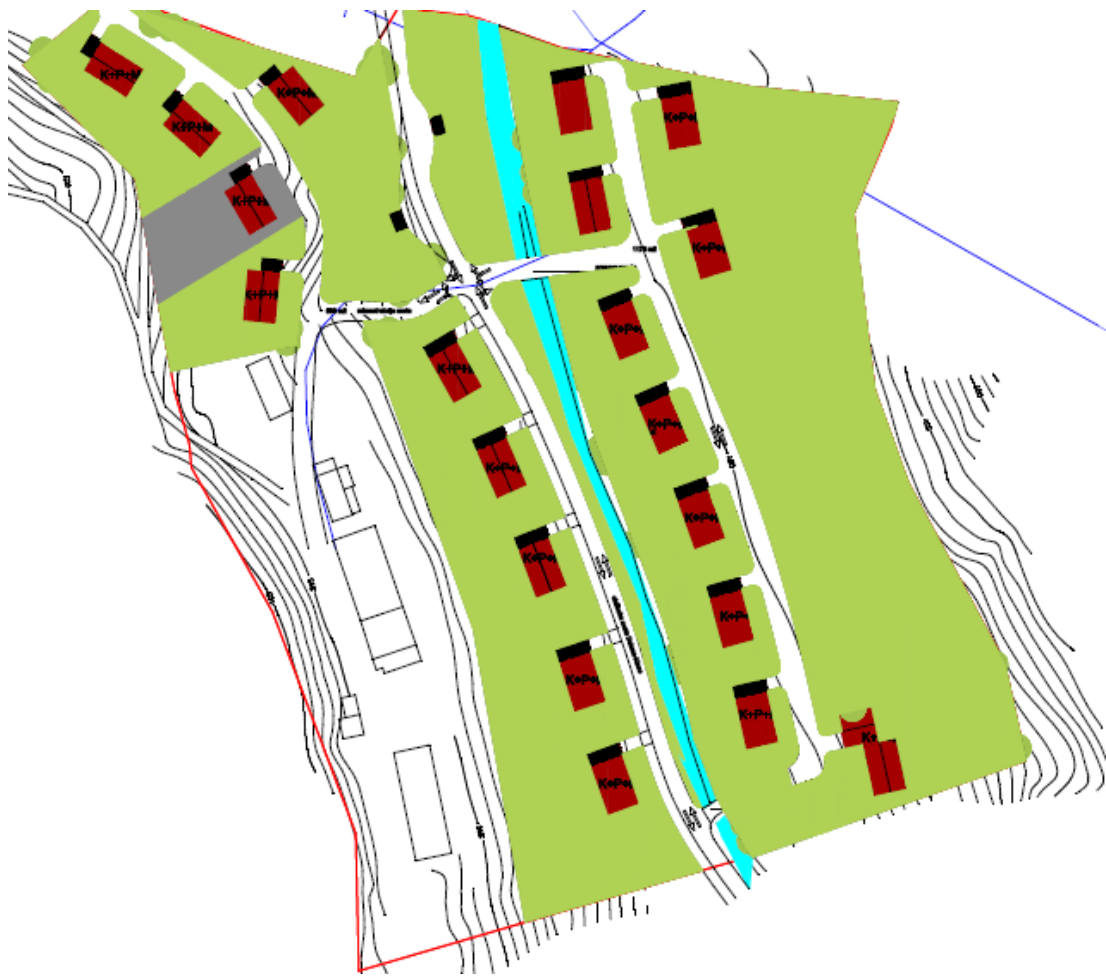
Slika: Izsek iz Lokacijskega načrta Zora

parc.št. 1826/23 v velikosti 1206 m 2 , parc.št. 1826/21 v velikosti 764 m 2 , parc.št. 1826/20 v velikosti 773 m 2 , parc.št. 1826/19 v velikosti 649 m 2 , parc.št. 1826/17 v velikosti 727m 2 , parc.št. 1826/15 v velikosti 708 m 2 , parc.št. 1826/14 v velikosti 645 m 2 , parc.št. 1826/13 v velikosti 552 m 2 , parc.št. 1826/12 v velikosti 581 m 2 , parc.št. 1826/16 v velikosti 860 m 2 , parc.št. 1813/10 v velikosti 931 m 2 , parc.št. 1813/12 v velikosti 168 m 2 , parc.št. 1813/14 v velikosti 1008 m 2 , parc.št. 1813/13 v velikosti 1207 m 2 , vse k.o. 1056-Dobrna.